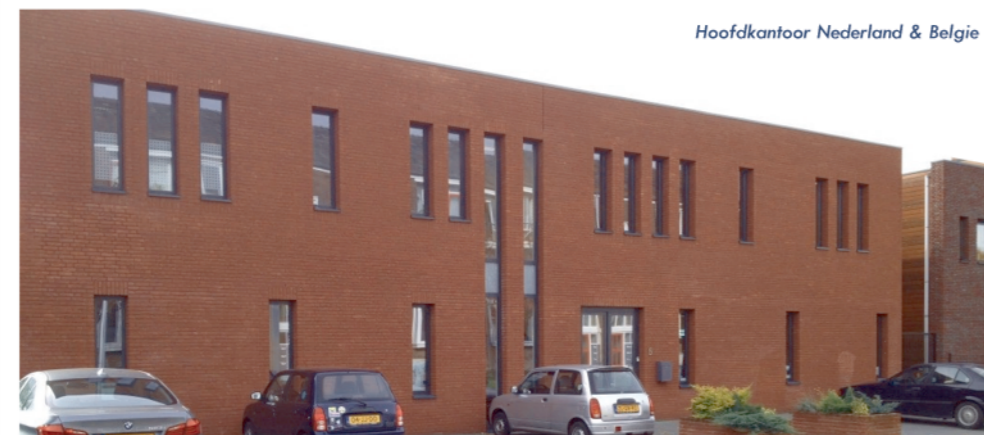
Hoofdkantoor Nederland & België